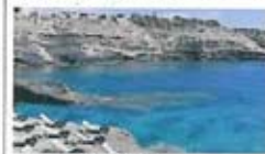
Bestresort Isole del Sud

A Lampedusa Bestresorts Isole del Sud, per minimo 7 notti. In Corsica I Hotel & Spa des Pêcheurs, minimo 7 notti. A Cipro il Bestresorts Thalassa Boutique, volo + soggiorno minimo 7 notti. In Grecia su questi prodotti volo + soggiorno, sempre per almeno 7 notti: a Santorini e Mykonos per tutte le strutture; a Creta Porto Elounda Deluxe Resort, Elounda Mare Hotel, Elounda Peninsula All Suites Hotel e St. Nicolas Bay Resort Hotel & Villa. Sul Mar Rosso il pacchetto volo + soggiorno per minimo 7 notti al Bestresorts Oberoi Sahi Hasheesh, Sheraton Soma Bay. In Egitto le Crociere sul Nilo, il tour in Libia e Dubai tutte le strutture, per minimo 4 notti. In Kenya il Bestresorts Lawford's con volo ITC + soggiorno minimo 7 notti. A Mauritius Beachcomber Hotels e Sun Resorts, nei pacchetti volo + soggiorno per minimo 6 notti. In India il Tour Triangolo d'Oro. Alle Maldivi il Bestresorts Gangehi Island Resort con il pacchetto di volo + soggiorno, sempre per minimo 7 notti.